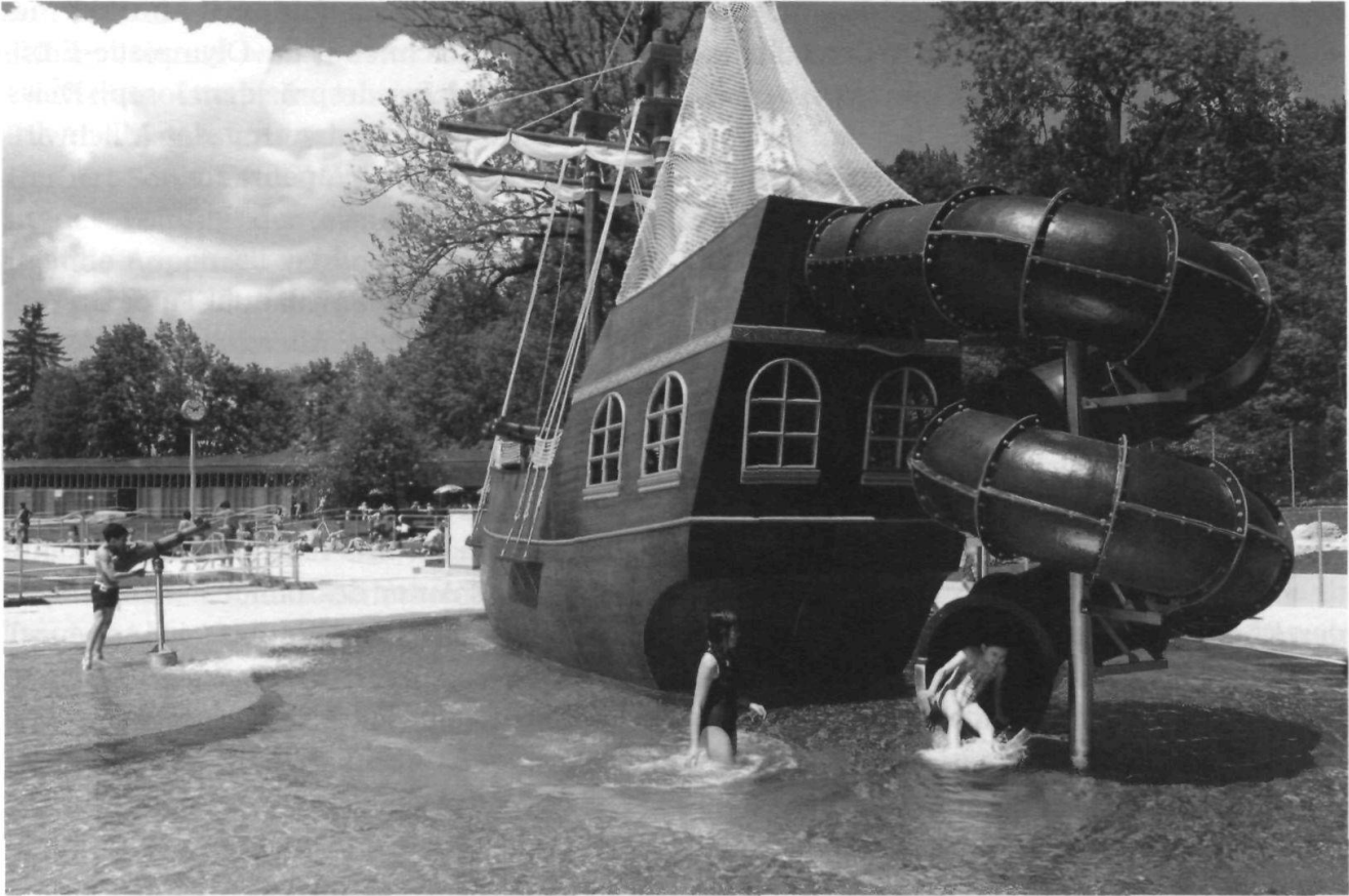
Das Schwimmbad Forren in Appenzell hat ein neues Gesicht, unter anderem mit einem Piratenschiff mit Rutschbahn.