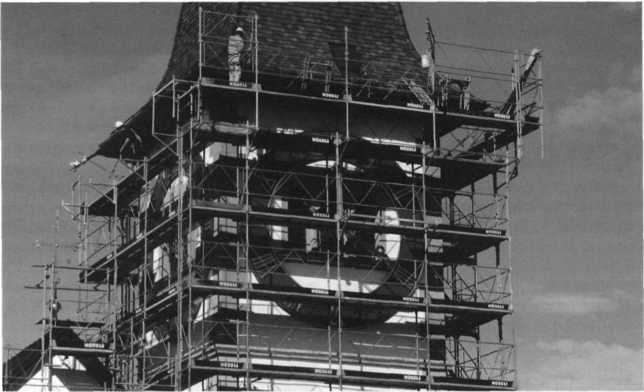
Die Maria-Hilf-Kirche in Haslen mit den ungewöhnlich grossen Zifferblättern (5,4 m Durchmesser) erfuhr eine erfolgreiche Restaurierung.