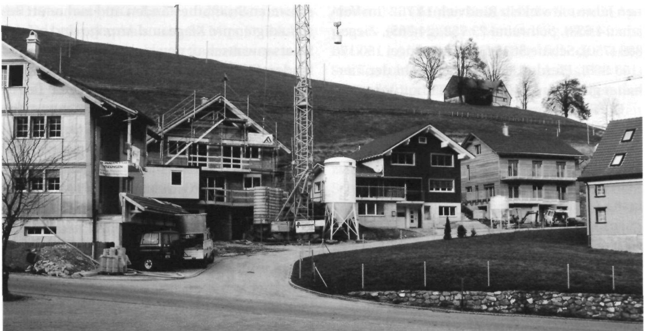
Schneller als geahnt nimmt die Überbauung auf der Liegenschaft «Gehresbisches» in Gonten Gestalt an.

Auch die Firma «Appenzeller Alpenbitter» hat Investitionen von drei Millionen Franken angesagt für einen Erweiterungsbau und einer neuen Teeabfüllmaschine. Mit den zwei Standbeinen nebst dem Spirituosengeschäft, der