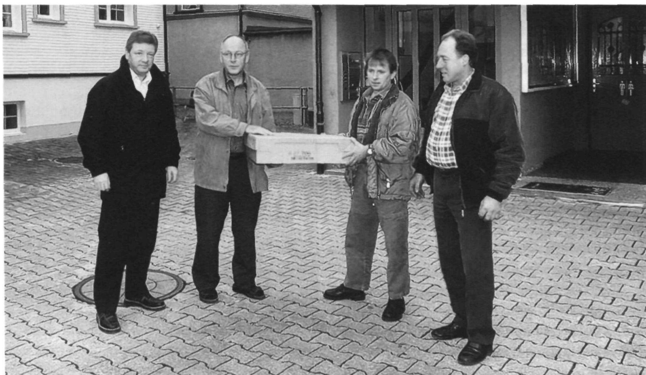
Mit einer Petition wehrte sich die Feuerwehr Kau gegen die Eingliederung in die Stützpunktfeuerwehr Appenzell.