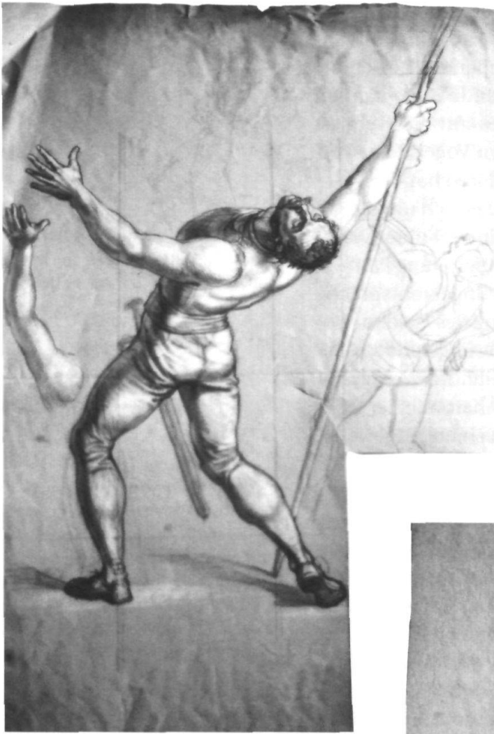
Rückwärts Fallender, Armstudie und Umriss.