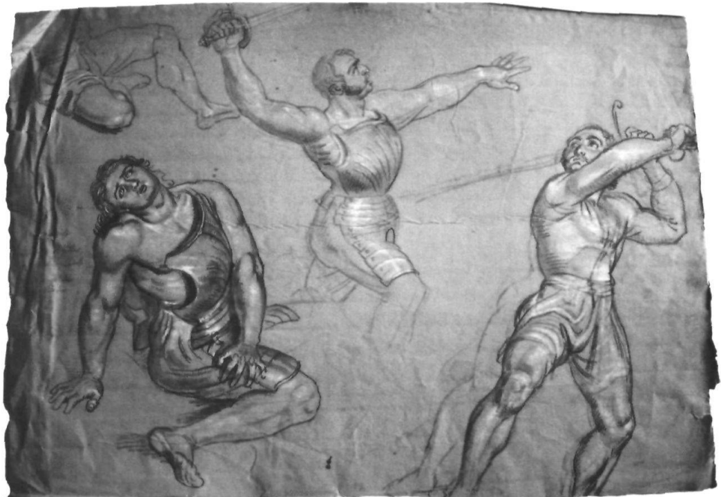
Kämpfende und Verletzte.