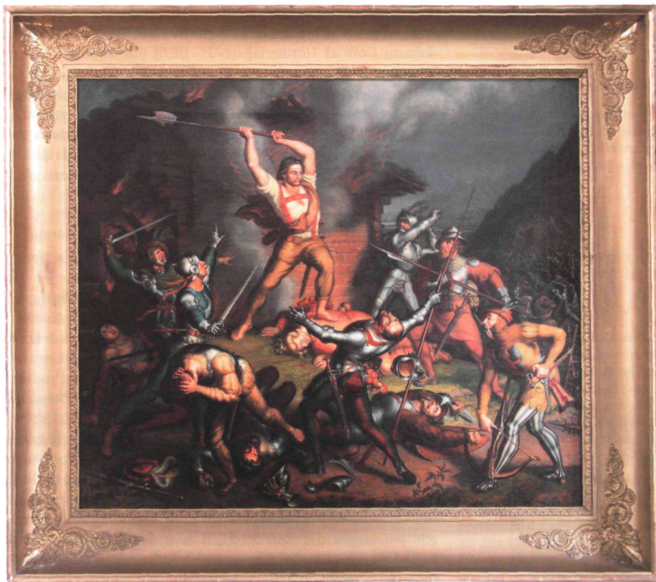
Ludwig Vogel: «Uli Rotach», Ölgemälde 1829 (Kantonsbibliothek Appenzell Ausserrhoden, Trogen).