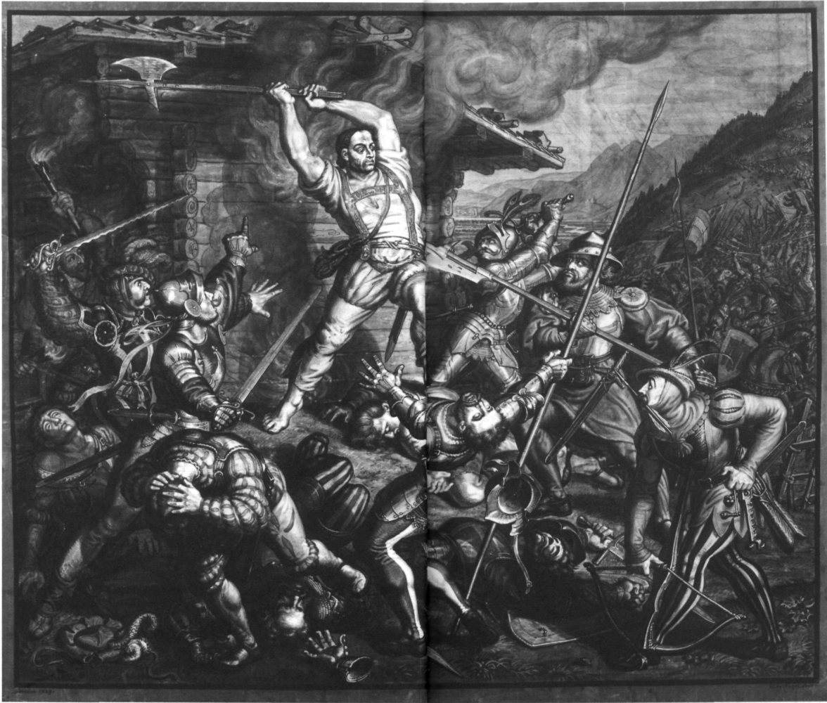
Ludwig Vogel: «Uli Rotach». Gouachezeichnung – 1829.