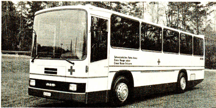
Nouvel autocar pour handicapés: Il est spécialement aménagé pour recevoir 20 handicapés en chaise roulante.

Chers parrains, chères marraines, ce sera pour vous certainement une grande joie d'apprendre que vous avez contribué, pendant ces 22 dernières années, à l'exploitation de nos trois cars pour handicapés, ainsi qu'à l'acquisition d'un nouveau car spécialement aménagé.