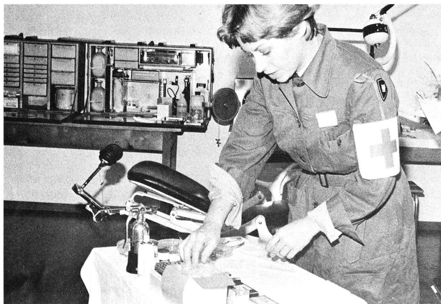
Une aide dentaire procédant aux préparatifs d'un traitement.