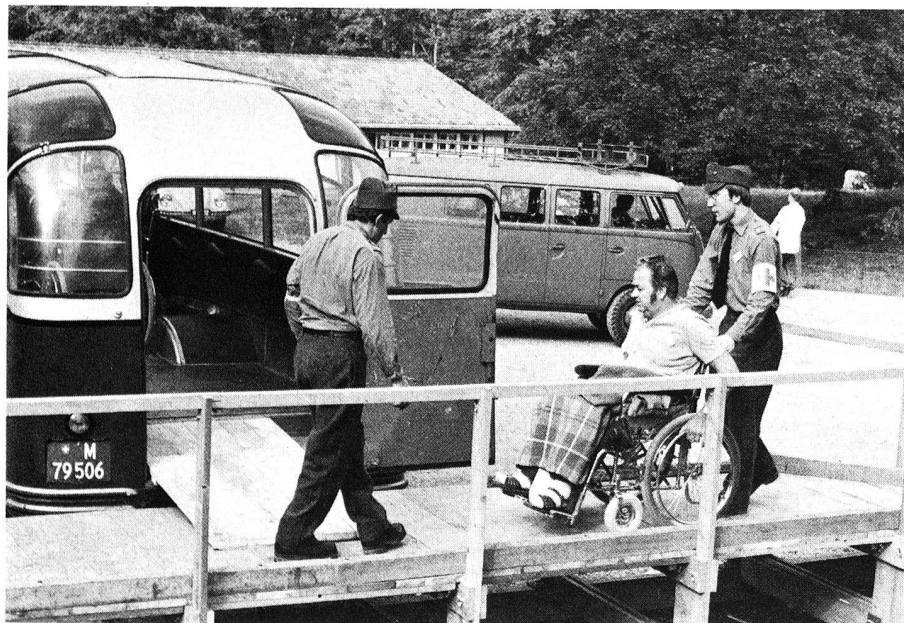
Des rampes spéciales, nouvellement installées, facilitaient le maniement des chaises roulantes.

Pour la troisième fois, l'armée a, au mois de septembre dernier, organisé en collaboration avec la Croix-Rouge suisse et d'autres organisations, un camp de vacances pour handicapés. «C'est mon plus beau service», déclare un appointé qui s'exprime certainement au nom de tous ses camarades; l'organisation a en fait un caractère plus militaire que lors des deux camps précédents, mais le contact avec les invalides représente pour nous un réel enrichissement et nous donne le sentiment de faire vraiment quelque chose d'utile. La satisfaction est beaucoup plus grande