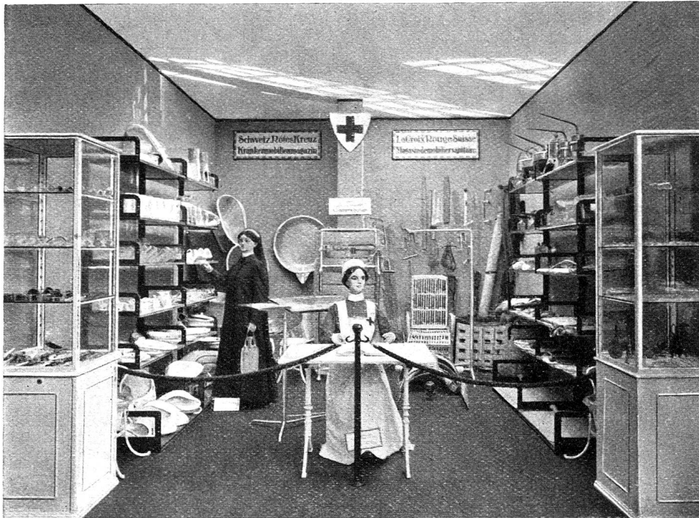
Magasin ou dépôt de matériel sanitaire de la Croix-Rouge suisse