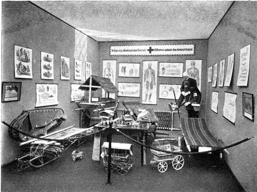
Alliance des samaritains suisses, Exposition de matériel de cours et d'improvisation