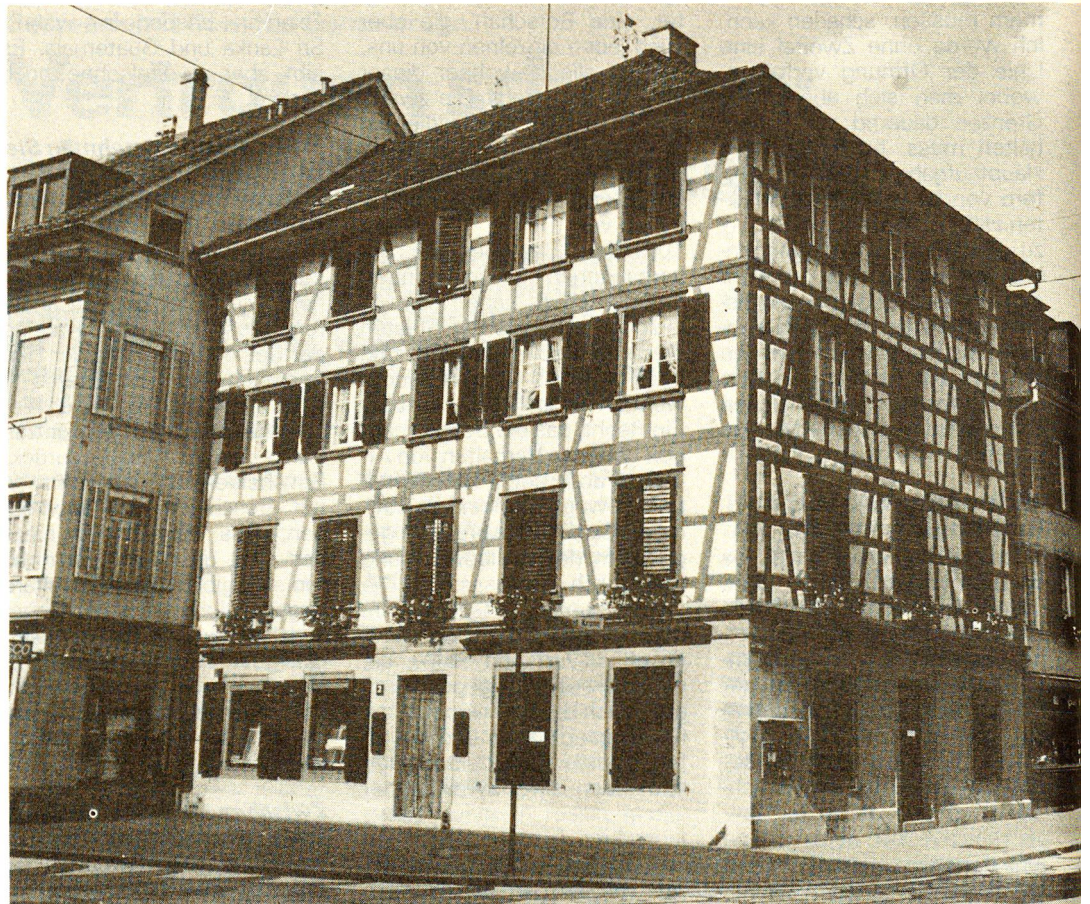
Fünf Hilfsorganisationen beherbergt das schöne Riegelhaus an der Metzggasse in Winterthur; eine davon ist das Schweizerische Rote Kreuz.

Die Jubiläumsfeier war mit Informations- und Demonstrationsveranstaltungen des SRK und der Korporativmitglieder verbunden und bildete die Fortsetzung und den Ab-