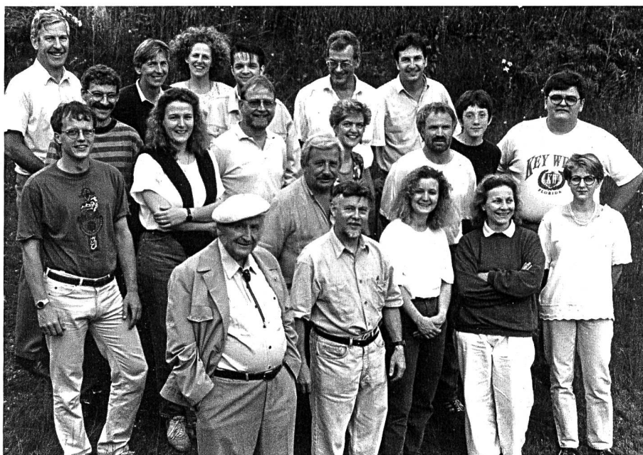
Das Ensemble von «Gounerbluet». Unter dem Patronat des «Schlüssels» entstand dieses Theaterprojekt und begründete die Tradition der Theateraufführungen auf dem Richtplatz.

Bei verschiedenen Projekten durfte der «Schlüssel» Reaktionen oder Verläufe herbeiführen, die das kulturelle Leben nachhaltig beeinflussten.