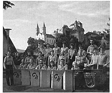
Big Band der Stadtmusik Aarburg 1982.

Ein Höhepunkt war bestimmt die Aufnahme einer eigenen Schallplatte im Jahre 1982.