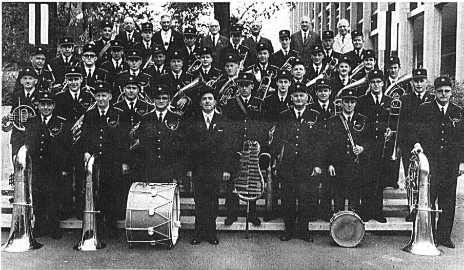
Eidgenössisches Musikfest 1966 in Aarau.

leisten. Man versuchte so, die Mitglieder vom Austreten abzuhalten.