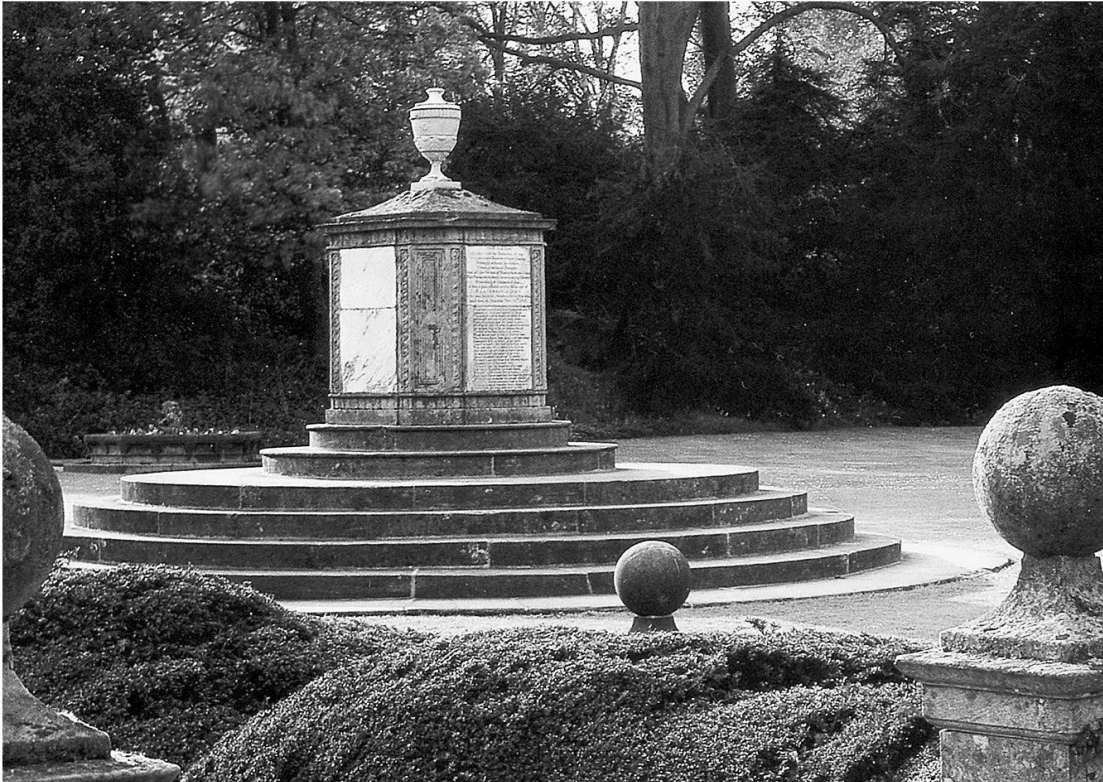
Abb. 1: Newstead Abbey (Nottinghamshire), Grabmal für Lord Byrons Hund Boatswain, 1808.

ersten Hälfte des 18. Jahrhunderts zahlreiche Gartenbesitzer den Entschluss, sich in ihren Garten- und Parkanlagen beisetzen zu lassen. 12 Wenn auch nicht ausschliesslich, so war das Phänomen der Gartenbegräbnisse offenbar eng an die Genese und Ausbreitung des Landschaftsgartens in Europa, vor allem in England, Frankreich und den deutschen Territorien, geknüpft. Eingebunden in den räumlichen und ideellen Kontext der Landschaftsgärten, wurden die Einzel- und Familiengrabstätten zumeist in Form von historisierenden Mausoleen und Grabmälern (unter anderen Pyramiden, Tempeln, Kapellen, Sarkophagen, Urnen und Obelisken) oder aber in Form nicht näher bezeichneter Grabhügel, Blumenpflanzungen oder Bäume angelegt. Neben den echten Gartengräbern wurde zugleich eine Vielfalt an Kenotaphen und Erinnerungsmonumenten für Familienmitglieder, Freunde und verehrte Zeitgenossen oder sogar rein fiktive Grabmäler für berühmte Protagonisten der Literatur oder Historie ausgeführt. Den Gestaltungs- und Wahrnehmungsprinzipien des Landschaftsgartens folgend sollten die überwiegend bereits zu Lebzeiten der Auftraggeber angelegten Grabbezirke beim Betrachter vielfältige Assoziationen und Emotionen hervorrufen. 13 Die Grabstätte in einem Garten wurde im Gegensatz zu den traditionellen und zunehmend kritisierten Begräbnisplätzen in und bei Kirchen nicht als abwei-