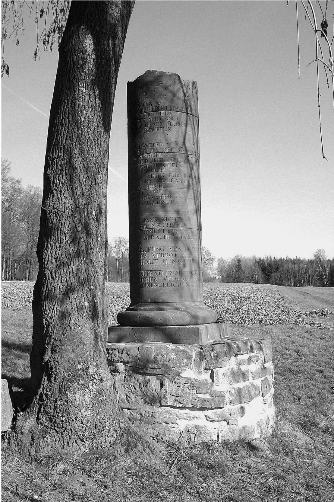
Abb. 4: Windhausen bei Kassel (Hessen), Affengrabmal, um 1785.