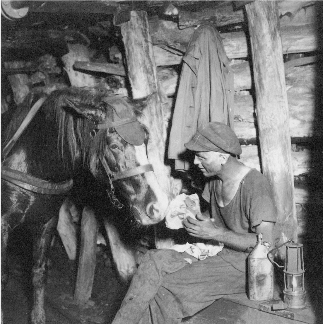
Abb. 2: Bergmann mit seinem Pferd beim Pausenbrot in der Zeche Robert Müser in Bochum, 1937.

Während die angebliche Erblindung der Grubenpferde kulturhistorisch-literarischen Zusammenhängen entstammt und mit der Realität nichts zu tun hatte, entsprach auch die «verbreitete Ansicht, dass häufig Augenverletzungen vorgekommen sein wären und ein Drittel der Pferde ein oder beide Augen verloren hätten [...] nicht den Tatsachen». Zwar gab es ein «entsprechendes Verletzungspotential an freiliegenden Elektro-, Wasser- und Luftleitungen, jedoch kam es nur in geringem Umfang zu derartigen Verletzungen». 15 Denn die Tiere trugen zu ihrem Schutz «Kopf-, Ohrenschutz und Stirnklappen aus harten Gummi bzw. Leder». 16 Hingegen waren die Pferde von Leiden wie Hufschäden oder infektiöse Erkrankungen wie Pferderotz oder Druse betrof-